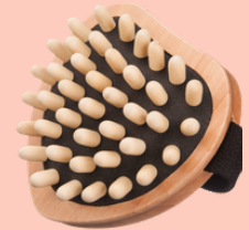
Cepillo de masaje anticelulitis N° 3321