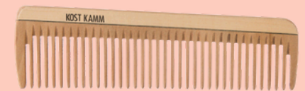
Peine de bolsillo ancho N° 17