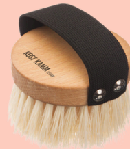
Cepillo de masaje de madera de haya N° 3332