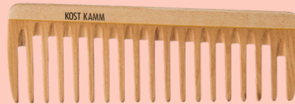
Peine de bolsillo extra ancho N° 18