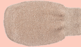
Guante de lino con cobre N° 3342