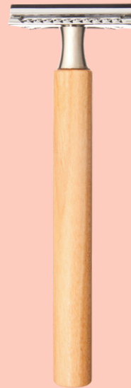
Maquinilla de afeitar para cuchillas de acero N° 722