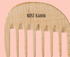
Peine para pelo rizado y ondulado N° 120