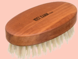
Cepillo para barba N° 23