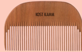
Peine de barba N° 205