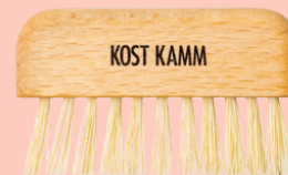
Limpiador de peines y cepillos N° 546