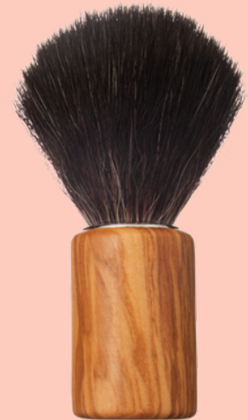
Brocha de afeitar vegana N° 622