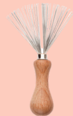
Limpiador de cepillo de metal y madera N° 545