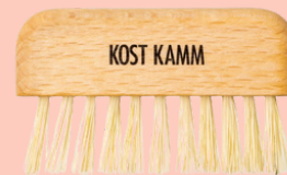
Limpiador de peines y cepillos N° 546