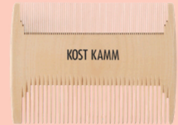
Peine para bebé doble lado N° 23