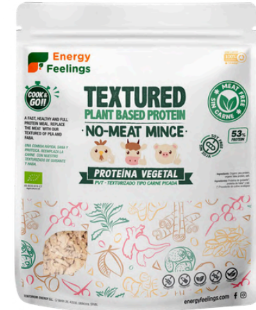
CARNE PICADA VEGETAL ECO