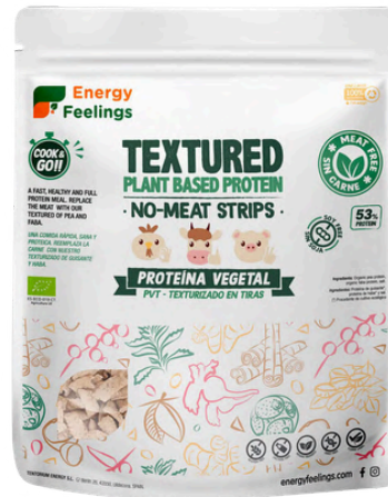
TIRAS DE CARNE VEGETAL ECO