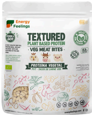
TACOS DE CARNE VEGETAL ECO