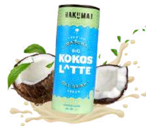
Kokos Latte con té matcha