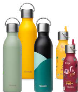
Active / Kids