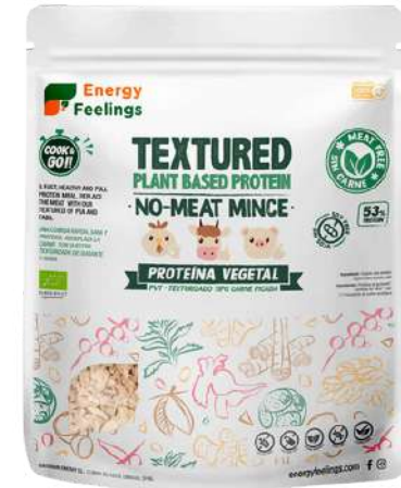
CARNE PICADA VEGETAL ECO