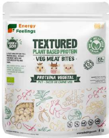
TACOS DE CARNE VEGETAL ECO