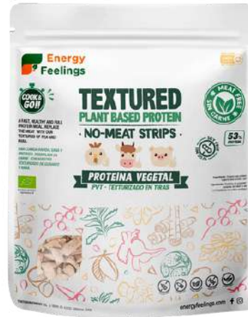
TIRAS DE CARNE VEGETAL ECO